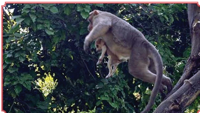
Chú khỉ luôn giữ chặt "con nuôi" của mình ở bất cứ đâu

Những hình ảnh tình cảm "cha con" giữa khỉ và chó: