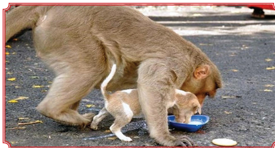
Chú khỉ luôn chia sẻ thức ăn với "con" của mình và bao đảm chó con ăn no trước khi thường thức bữa ăn.