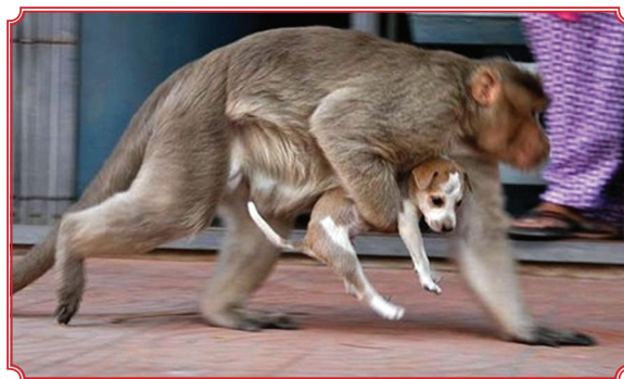
Câu chuyện được lan truyền nhanh chóng trên Internet và rất nhiều người cảm động, thán phục tình cảm giữa hai con vật khác biệt nhau.