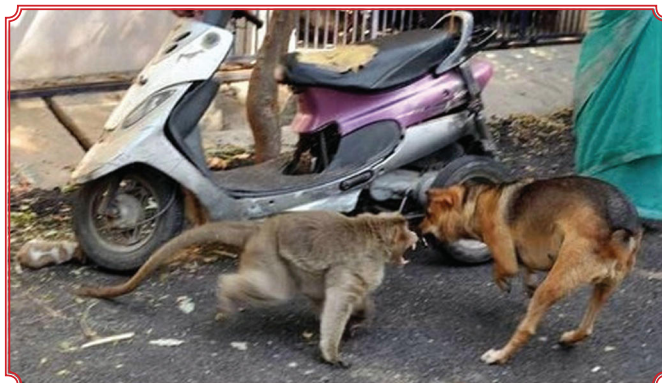
Chú khỉ bảo vệ chó con khỏi bị bắt nạt bởi những con chó khác lớn hơn.